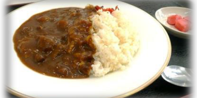
山形牛、西川町産つや姫使用 牛すじカレー 500円 (税込)