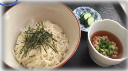
納豆麦切り 500円 (税込)