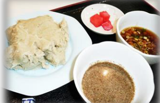
かいもち 500円 (税込)