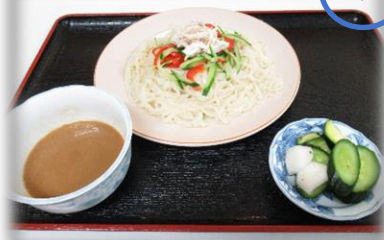
ゴマだれ麦切り 500円 (税込)