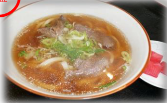
牛すじうどん 500円 (税込)