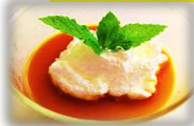
カスタードプリン