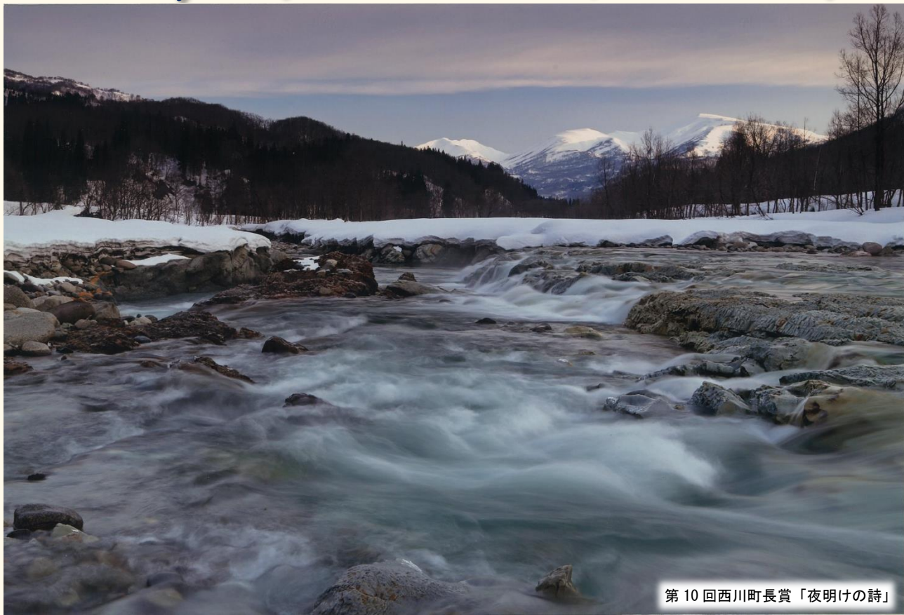
第10回西川町長賞「夜明けの詩」