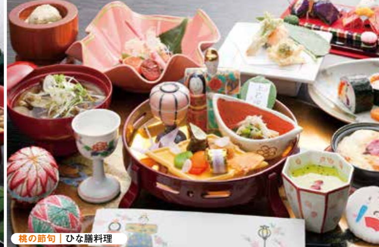
桃の節句 | ひな膳料理