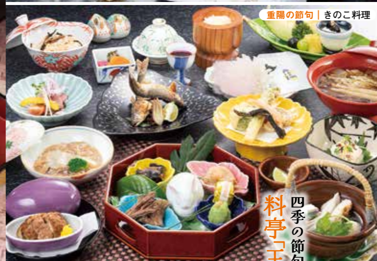
重陽の節句 | きのこと料理