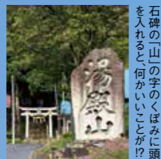
石碑の「山」の字のくぼみに頭を入れると何かいいことが!?