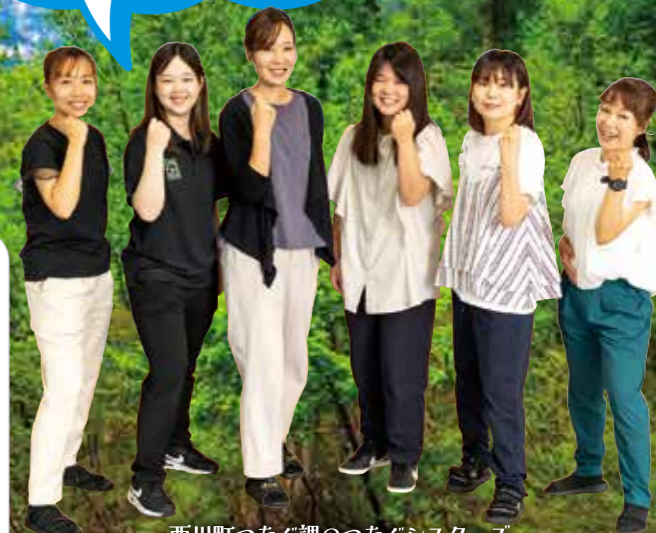
西川町つなぐ課のつなぐシスターズ