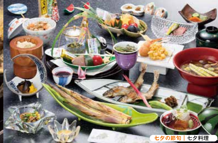
七夕の節句 | 七夕料理

やまろく食堂 ☎0237-74-2169 西山村山郡西川町間沢309-1 圖11時～19時 図月 山菜料理 出羽屋 ☎0237-74-2323 西山村山郡西川町間沢58 圖11時30分～14時 図火 レストラン花笠 ☎0237-75-2045 西山村山郡西川町山沢110 圖9時～19時 図不定休 清水屋旅館 ☎0237-75-2211 西山村山郡西川町志津20 圖要予約 図不定休 仙台屋 ☎0237-75-2218 圖11時～14時 図不定休(要予約) 民宿 橋本荘 ☎0237-76-2353 西山村山郡西川町大井沢1181-3 圖11時30分～14時 図月(要予約) 変若水の湯 つたや ☎0237-75-2222 西山村山郡西川町志津10 圖12時～13時30分 図不定休