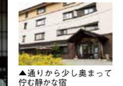
▲通りから少し奥まって佇む静かな宿

①端正なたずまいの和洋室 ②半露天風呂付き和モダンの特別室 ③ロビー、客室の窓の外には豊かな大自然が広がっている