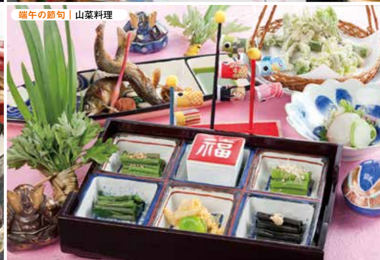
端午の節句 | 山菜料理