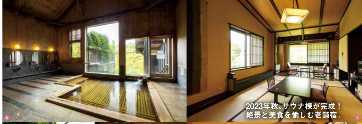
2023年秋、サウナ棟が完成! 絶景と美食を愉しむ老舗宿。