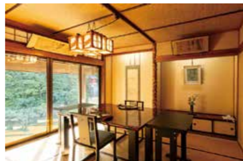
▲寒河江川と対岸の自然を借景に、食事を楽しむ個室ダイニング