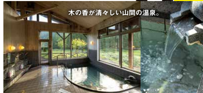
木の香が清々しい山間の温泉。