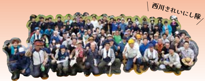
西川きれいにし隊